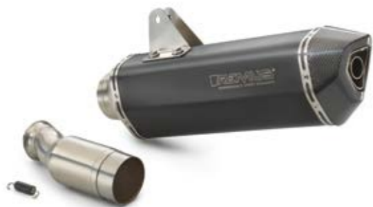
SILENZIATORE REMUS SLIP-ON