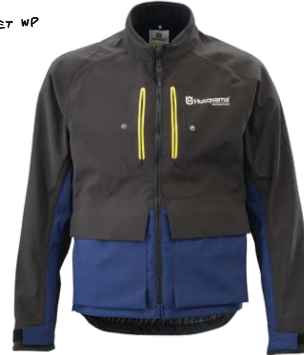
GOTLAND JACKET WP

CONFORTEVOLI, VENTILATI E IMPERMEABILI. QUESTA COMBINAZIONE DA OFFROAD LEGGERA MA RESISTENTE PONE PARTICOLARE ATTENZIONE AI DETTAGLI, GARANTENDOTI DI ESSERE PRONTO DAVANTI A QUALUNQUE CONDIZIONE.