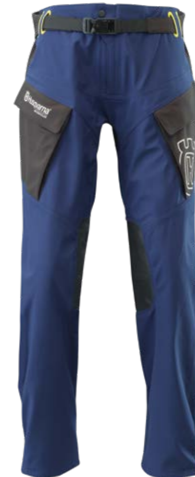
GOTLAND PANTS WP

CONFORTEVOLI, VENTILATI E IMPERMEABILI. QUESTA COMBINAZIONE DA OFFROAD LEGGERA MA RESISTENTE PONE PARTICOLARE ATTENZIONE AI DETTAGLI, GARANTENDOTI DI ESSERE PRONTO DAVANTI A QUALUNQUE CONDIZIONE.