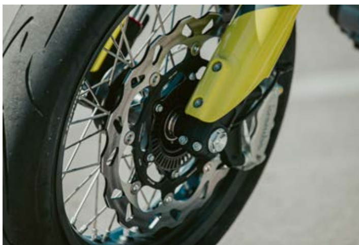
DISCO DEL FRENO WAVE