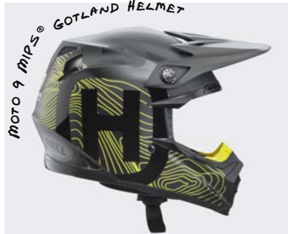
MOTO 9 MIPS® GOTLAND HELMET