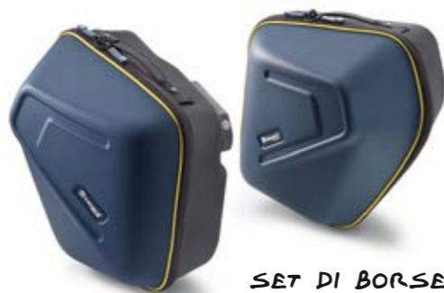
SET DI BORSE LATERALI